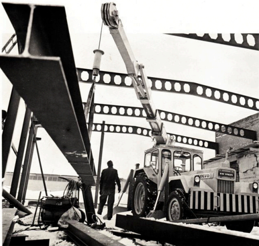
MK 691 kommer till sin rätt på trånga bygplatser. Maskinen kommer snabbt i arbetsposition och kranen arbetar följsamt och exakt med tung last. Räckvidd 11 m, Lyfthöjd 14 m.

För hydraulisk manövrering av t. ex. grip och rotator utrustas kranen med en fjärrstyrd omkastarventil så att föraren kan alternera mellan vipparmrörelser och manövrering av redskap. Om endast en hydraulfunktion erfordras finns möjlighet till snabbkoppling av slangarna till anslutet redskap och vipparmens teleskopcyllinder.