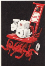
Modell 51081 5 Hk

Modell 51084 är den andra fräsen med samma motoreffekt, 3,5 hk. Som extra finess på denna maskin finns en lättmanövrerad backväxel.