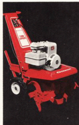
Modell 51082 5 Hk

Den här är den populäraste Gilsonfräsen. Motorstyrkan garanterar ett snabbt och effektivt arbete även i blöt och lerig jord. Motors placering över knivrotorerna ger en låg tyngdpunkt och en perfekt balans. Försedd med back.