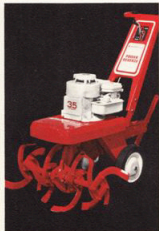
Modell 51084 3,5 Hk

Modell 51014 är den minsta fräsen i Gilsonserien, men den klarar de flesta jobben i villaträdgården. Konstruktionen är trots det låga priset av synnerligen hög klass. Kan liksom de övriga fräsarna förses med en mängd tillbehör.