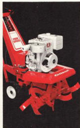
Modell 51083 8 Hk

En synnerligen kraftig och stabil jordfräs med skärrotorer och traktormönstrade stödhjul. Den är försedd med 2 växlar framåt samt back.