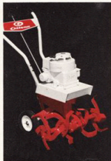
Modell 51014 3,5 Hk

Modell 51014 är den minsta fräsen i Gilsonserien, men den klarar de flesta jobben i villaträdgården. Konstruktionen är trots det låga priset av synnerligen hög klass. Kan liksom de övriga fräsarna förses med en mängd tillbehör.