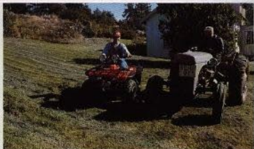
Gårdens gamla tröjnjare möter den nya

Upptäck hur Honda lyckats förenkla råstyrka med perfekt balanserade köregenskaper. Sätt TRX 300 på prov hos din Hondahandlare.