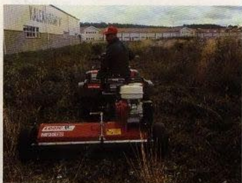
Slaghack för grov- och finklipp