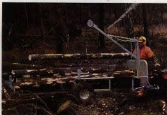
Gallringsekipaget. -Varför inte göra det lätt för sig..?