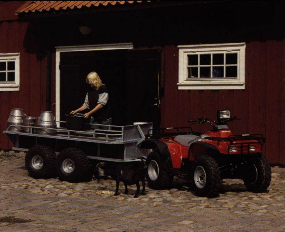
Honda TRX 300 med Bogglekära utanför "Bonnegården" i Borås Djurpark