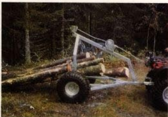
Lunningskärra för gallringvirke och stockar