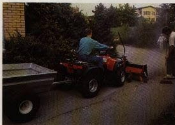
Honda TRX 300 utrustad för fastighetsskötsel. Roterande borste och dumperkärra