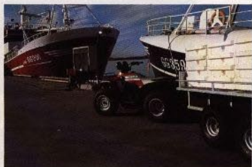
Fina fisken! Räkna med tidsbesparingar