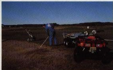
Lättfotade TRX 300 lämnar inte ett spår efter sig. Inte ens på green...