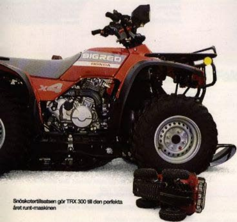
Snöskotertillsatsen gör TRX 300 till den perfekta året runt-maskinen