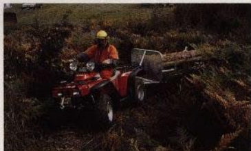
Vem sa att effektiva skogsmaskiner måste vara stora?