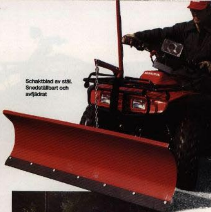
Schaktblad av stål. Snedstälbart och avfjädrat