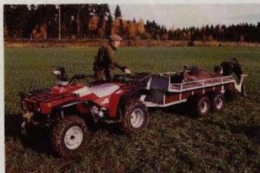
Jakttycka är att få hem bytet utan ryggsäck

Tag ut kompassenihängen och kör. Med TRX 300 ser du dig fram i all slags terräng