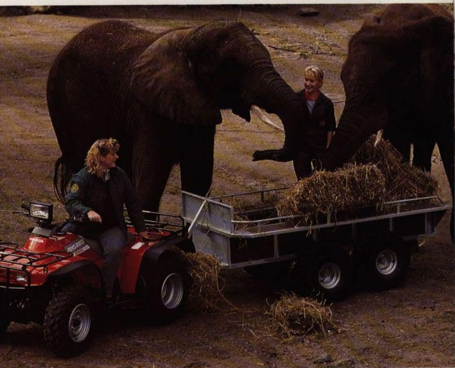
Utfodringsdags vid elefantstallarna i Borås Djurpark