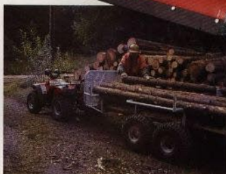
Carlmans timmerboggie. Tar lätt en fast kubikmeter