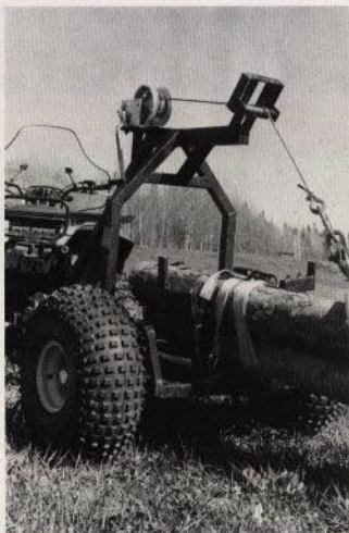
Kompis ATV-timmervagn med vinch. Stora, kraftiga hjul ger den mycket god framkomlighet i terräng.