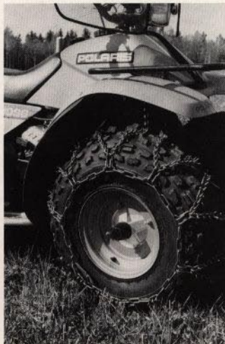
Figgjedjur som ger din Polaris ännu bättre framkomlighet i vinterföre.

Utöver dessa finns en mängd tillbehör och utrustning till din POLARIS fyrhjulning. Hör med din återförsäljare.