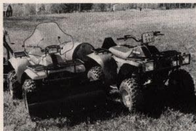
Vindskydd för förarens bekvämlighet. Kraftig snöplög för frontmontering.