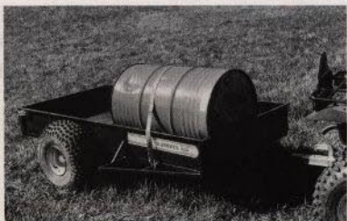
Kompis ATV-vagn, finns även i boggieutförande. Kraftigt utförande. Lastkapacitet 400 kg.