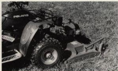
Gräsklippare med stark fyrtaktsmotor.