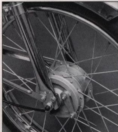
Funktionella, säkra och skyddade trumbromsar är en självklarhet som betyder trygg körning.