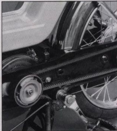
Kraftöverföringen är steglös och automatisk tack vare den unika remtransmissionen. Det betyder mjuk och smidig gång.