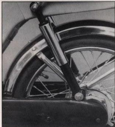
Bakfjädringen - svingarm med dubbla stötdämpare - är ett extra plus på Baghee.