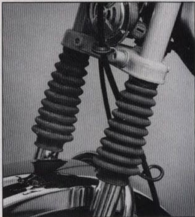
Baghee är utrustad med kraftig framgaffel med teleskopfjädring istället för enkla gummilänkar som är vanligast i den här klassen.