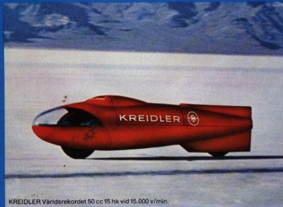
KREIDLER Världsrekordet 50 cc 15 hk vid 15.000 v/min.

210 km/tim = det absoluta världsrekordet i 50 cc klassen. En enastående prestation. Det betyder högsta tekniska perfektion. (För övrigt, den absoluta topphastigheten för en 50 cc KREIDLER är 225,345 km/tim.)