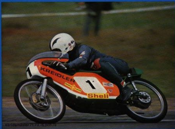
Världmästar 71, 73, 74 och 75

Belåtna kunder är det viktigaste för oss. Därför finns det auktoriserade KREIDLER-försäljare på ett flertal platser till Din tjänst.