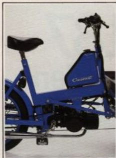
Ny ramkonstruktion helt baserad på fyrkantströr Ny bensintank