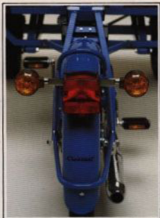
Nya blinkers fram och bak