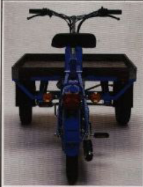
Kapell extra tillbehör