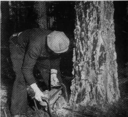
Här nedan däremot sågas fällhugget; första momentet är horisontalt-skåret eller skåret underifrån.