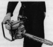
Bärning i sele vid höften.

Den sistnämnda reflektionen bör särskilt understrykas. Självfallet måste den största försiktighet iakttagas med en motorsåg, som utvecklar så stor kraft som JO-BU, men genom att följa de råd och anvisningar, som åter-