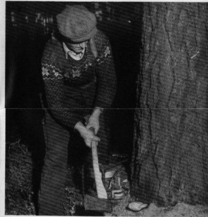
Här ovan slår motorsågsiktören ytterligare några slag på träkilen för att få rätt fällningsriktning och förebygga att trädet nyper.