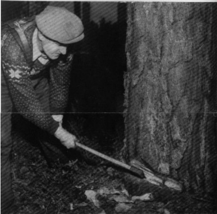
Motorsågsiktören här ovan gör fällhugg med yxa på vanligt sätt. Observera att fällhugget kan göras mindre än vid fällning för hand.