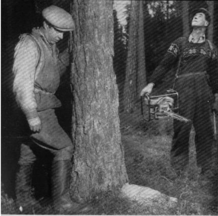
Vänstra delen av bilden visar hur man får låg stubbe: trampa ned mossan! Till höger konstateras fällningsriktningen.