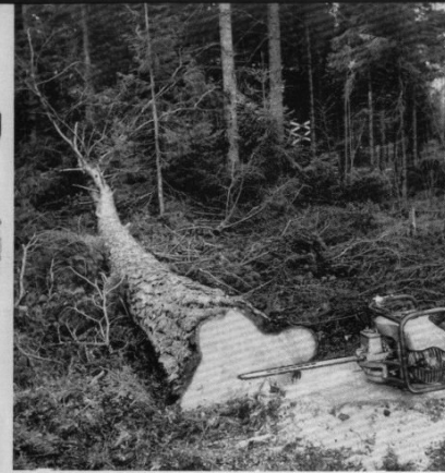
Den rödgrava furen här ovan har nu fallit. Fort och utan ansträngning.

Gör som den bekyrrade lilla mannen med timmersvansen här ovan: kalla på JO-BU! Då får arbetet i skogen en ny melodi. JO-BU gör slut på slitet och räddar ryggar.