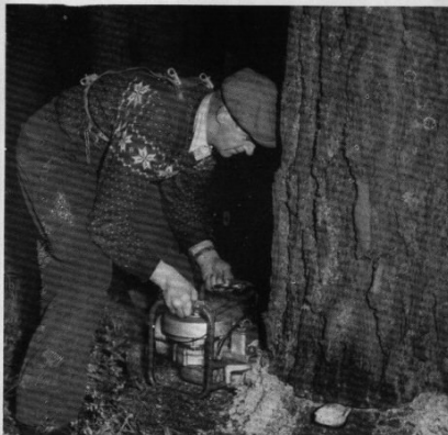
Här nedan är ungefär halva stammen genomsågad. Fällkilen (av trä) har slagits in i skåran.

Norsk teknik och svensk kvalitetsstål i förening har skapat enmans-motorsågen JO-BU, som helt slagit igenom just därför att den gör slut på slitet i skogen. Upphovsmannen till den med största precision tillverkade fällningsmaskinen är en vapenexpert. JO-BU har också blivit ett effektivt vapen inom skogsbruket.