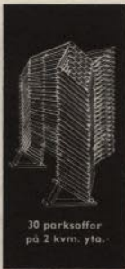
30 parksoffor på 2 kvm. yta.