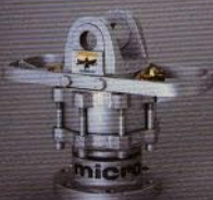
MICRO: Lätt rotator med agenskaper som gör den lämplig för alla kranar i den professionella skogshanteringen.