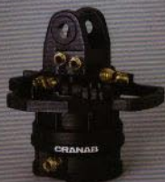
GV 10-104: Rotatorn finns utrustad med två extra svivelkanaler för arbeten med gripsåg och fällgripsåg.