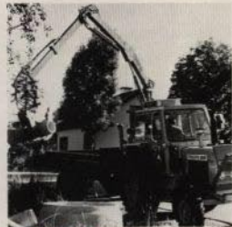
FMV 2500-H på entreprenadtraktor

monterad på stativ med hydrauliska stödben i snabbkopplingsram