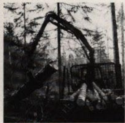
FMV 2500-H i skogsbruk på vagn kompletterad med lunningsvinsch