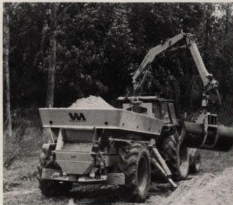
med insatsskopa – alternativt jordbruksgrip – för kalk, gödsel, jord, sten, grus och sand