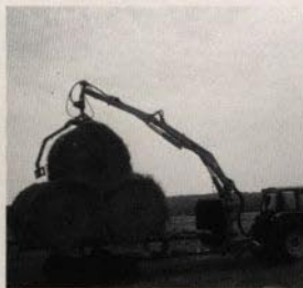
med balgrip för storbal