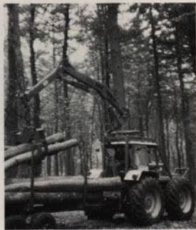
takmonterad på skogstraktor