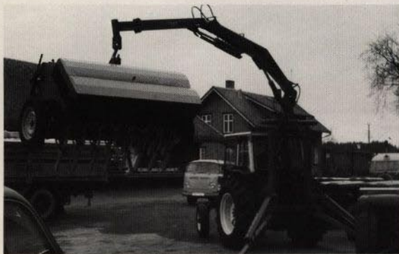
med krok för tunga lyft, storsäck och liknande