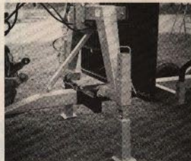
Mekaniska stödben. Kranen lätt flyttbar mellan vagn och traktor beroende på arbetsuppgift.