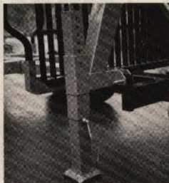
Mekaniska stödben i parkeringsläge