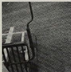
Hjulen utanför stöttor för skonsamhet mot träden.