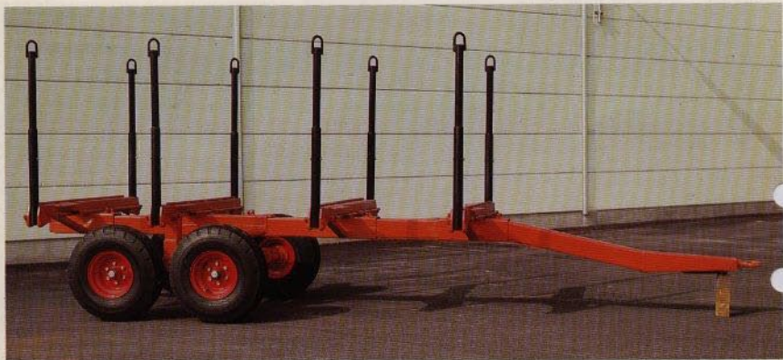
Extra bankar för transport av meterved.