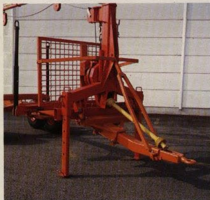
Gisebo har utvecklat tillbehör som gör skogsvagnarna ännu mer användbara. Skyddsgrind som extra säkerhet för förare. Fästkonsohl för vagnmonterad kran, monteras på centralröret med buntförband. Anpassad till följande fabriker, FMV, LIMA, NORMET och STAR.