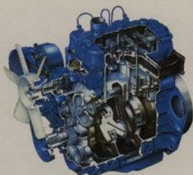
Vätskekyll, trecylindrig dieselmotor