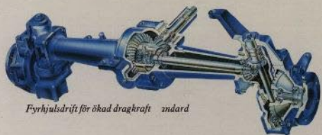
Fyrhjulsdrift för ökad dragkraft standard