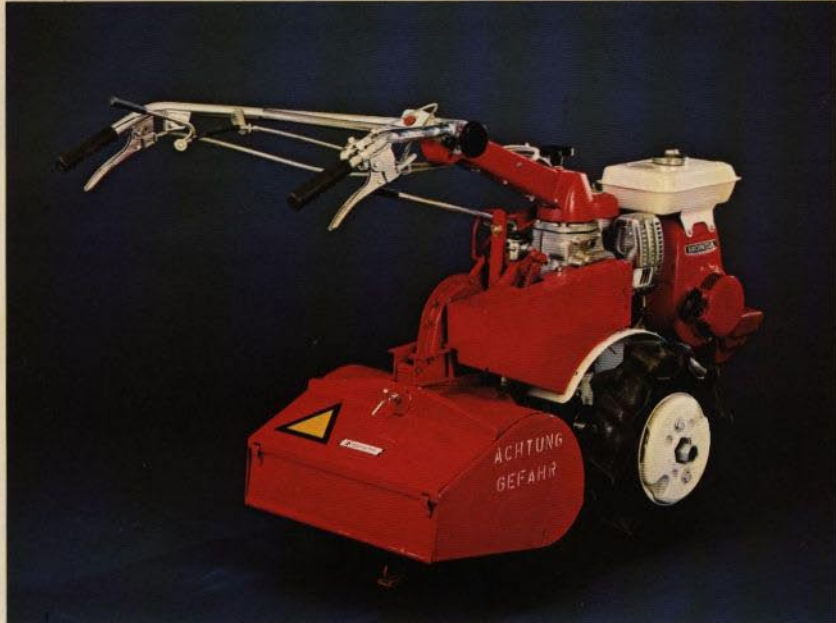
HONDA F-42 med bakmonterat fräsaggregat.

Honda tvåhjulstraktorer är konstruerade och byggda för »året-runt-bruk». Urvalet av redskap, som vi presenterar i denna broschyr har visat sig erfarenhetsmässigt täcka de flesta behov för både villaägaren och yrkesmannen.