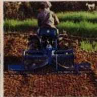
Sladd för avjämning av torra fält