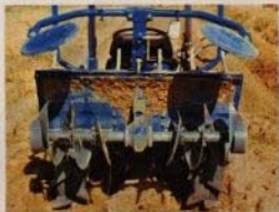
Roterande skärplog (bakmonterad) höjd och bredd inställbar