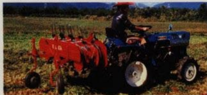
Roterande krattor för vändning av hö