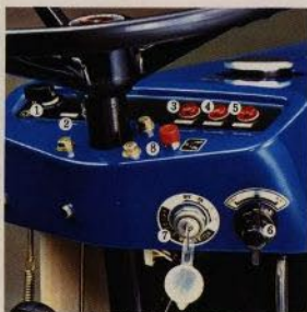
Instrument och strömbrytare