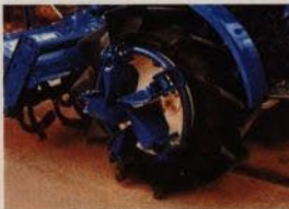
Fritt upphängda hjul (LB 175) för användning vid bearbetning av lösare jordlager