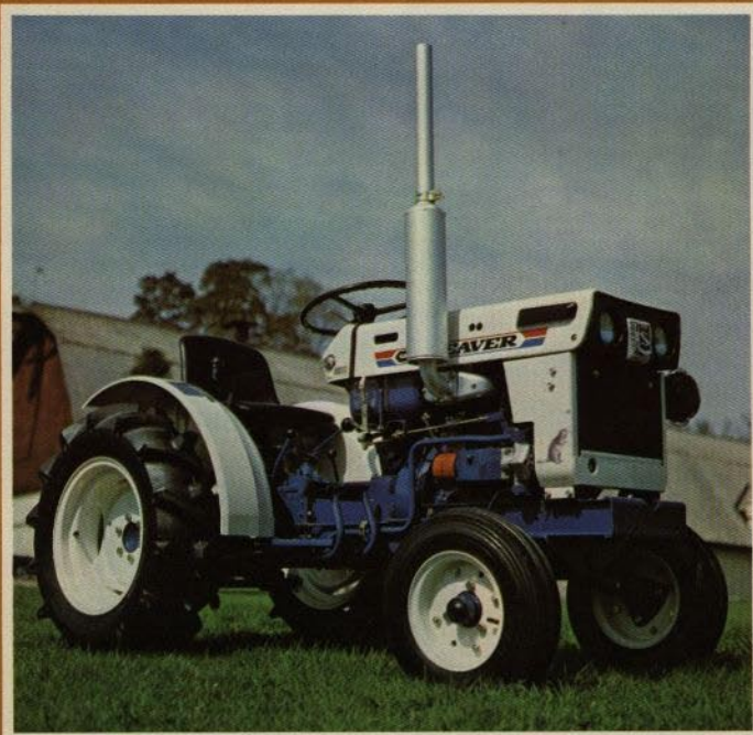
Satoh Beaver S-370 2-hjuladriven med lämbrukshjul (AG) Vikt: 470 kg