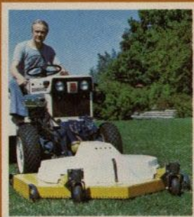
Rotorgräsklippare En robust men lättmanövrerad klippare som medger snabb avverkning av stora ytor Arbetsbredd standard 125 cm