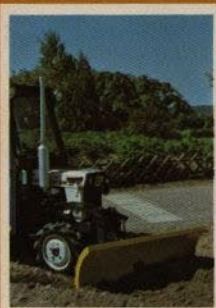
Plagblad/Schaktblad Det rätta tillbehöret vid t ex snörbjörning av gångbanor Standardbredd 140 cm