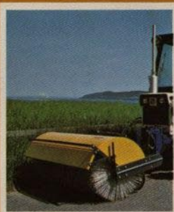
Borstaggregat En roterande sopvats lätt inställbar för t ex rensning av löv och promenadvägar Arbetsbredd standard 120 cm