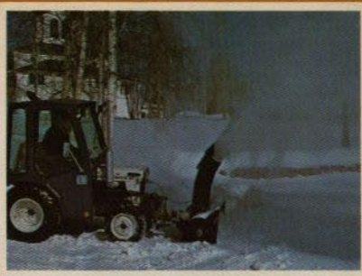
Snöslunga En kraftig enstegslunga med utkastöret elektriskt reglerbart från förarhytten Arbetsbredd 125 cm

Beaver är dessutom det ekonomiska alternativet med sitt låga pris och låga driftskostnad.