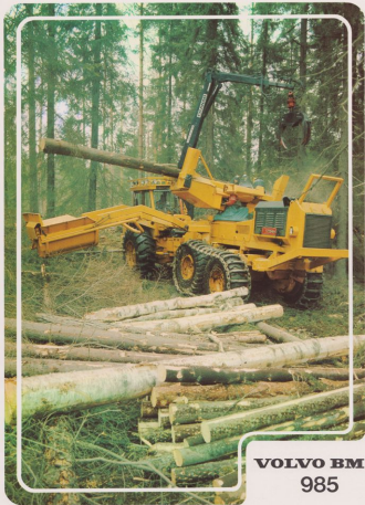
VOLVO BM 985