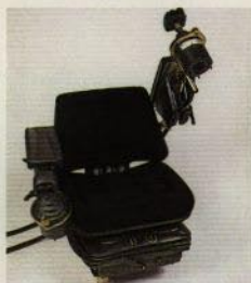
Som allt, kan du installera EHC reglage med fullständig fjärrkontroll via 2 joystick.