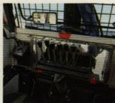
Med en lättmanövrerad reglagebox sköter du kranens alla funktioner.