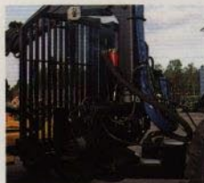
Lågt kranfäste ger lägre tyngdpunkt för ökad stabilitet.