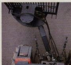
Vagnstyrning som standard ger överbträffad framkomlighet i skogen.