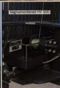
Vagnsmonterad HV 100