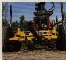
Regjäl markfrigång med slät undersida.

Våra vagnar, som vi tar fram i samarbete med Moheda, har blivit mycket populära hos skogsbonden.