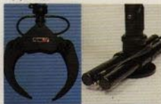
Lågbyggd grip med bra kapacitet. Gjutna vridmotor i segjärn och underhållsfri svängmekanism i oljebad.