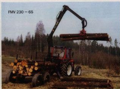
FMV 230 - 6S