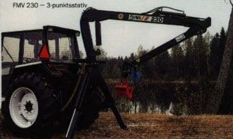
FMV 230 – 3-punktsstativ