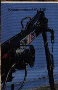
Kranmonterad HV 100