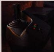
Lättmanövrerade minispakar finns som tillbehör.