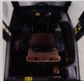
En arbetsplats att längta till.